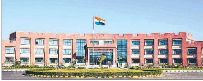
महेंद्रगढ़। हरियाणा केंद्रीय विश्वविद्यालय।