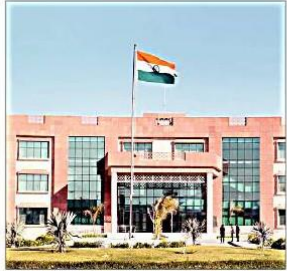
हरियाणा केंद्रीय विश्वविद्यालय महेंद्रगढ़। संवाद

उन्होंने कहा कि शिक्षा मंत्रालय द्वारा जारी की गई एनआईआरएफ रैंकिंग में हकेंविवि ने 151 से 200 के विश्वविद्यालय रैंक बैंड में स्थान हासिल किया है, जो हम सभी के लिए खुशी और गर्व की बात है। उन्होंने कहा कि इस रैंकिंग को और बेहतर बनाने और टॉप 100 रैंक में शामिल होना हमारा अगला लक्ष्य है और आशा है कि सभी सहभागियों के सहयोग से इस भी